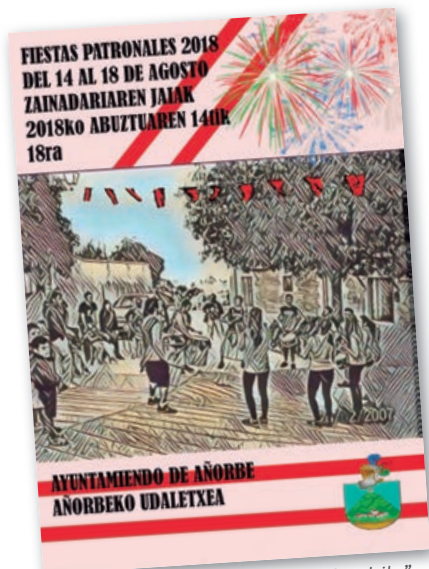
"El jaleo de siempre/Betiko iskanbila" Uxue Sagardoy